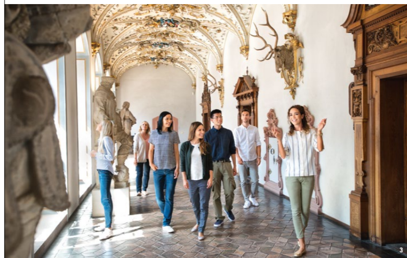
👑 19世紀には豪華な装飾が加えられた。漆喰の天井や木と砂岩からなる門が印象的なフリードリヒ館。

ハ イデルベルク城の印象的な遺跡には、毎年世界中から約100万人の観光客が訪れます。19世紀初頭以来、ロマン主義の代名詞ともなっています。