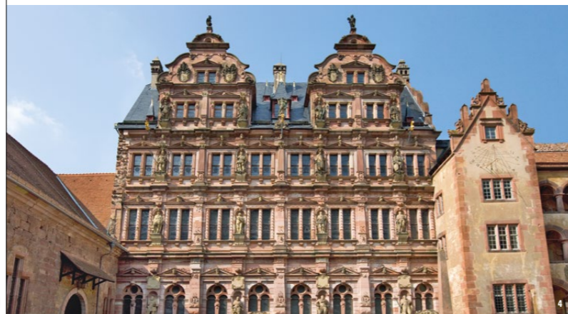
👑 フリードリヒ館から誇り高く見つめるプファルツ選帝侯の先人たち

ここより印象深い場所はどこにもないといついでしょう。ネッカー渓谷の砂岩からなるその姿は赤みを帯び、緑深いケーニヒシュトゥール(Königstuhl)の北壁を背にそびえ立ちます。このシルエットこそ、ハイデルベルク旧市街のイメージを際立たせています。