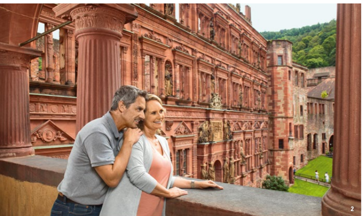
👑 ドイツルネサンス期の珠玉：オットハインリヒ館

輝かしく変化に飛んだハイデルベルク城の歴史は、後にプファルツ選帝侯となるライン宮中伯がここに居を構えた時に始まります。歴史上、初めてこの城が言及されたのは、1225年です。それからまもなく、ルネサンス期の最も代表的な居城の一つとして、増設されることになります。