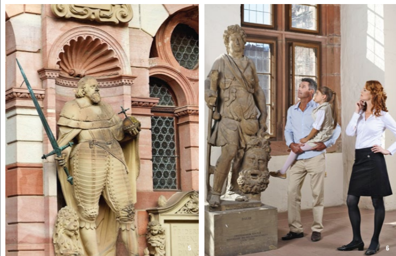
👑 多くの彫像が宮殿を飾る。写真はプファルツ選帝侯フリードリヒ5世の立像。