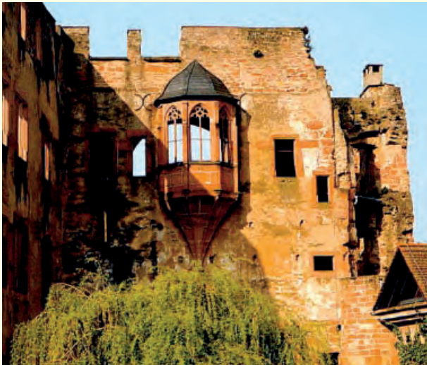
Erker am Bibliotheksbau

Die Entwicklung der Residenz von der Wehrburg zum repräsentativen Wohnschloss ist heute noch an der Ruine abzulesen. Schnuppern Sie hinein in den Alltag von Kurfürsten, Knechten und Kammerdienern, die diese Mauern belebten.